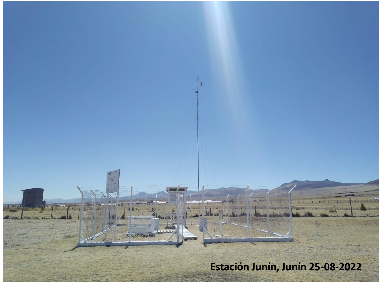
Estación Junín, Junín 25-08-2022