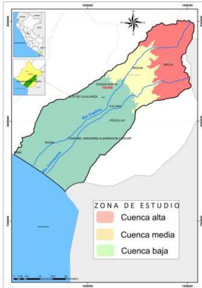
Mapa N° 01 Zona de estudio