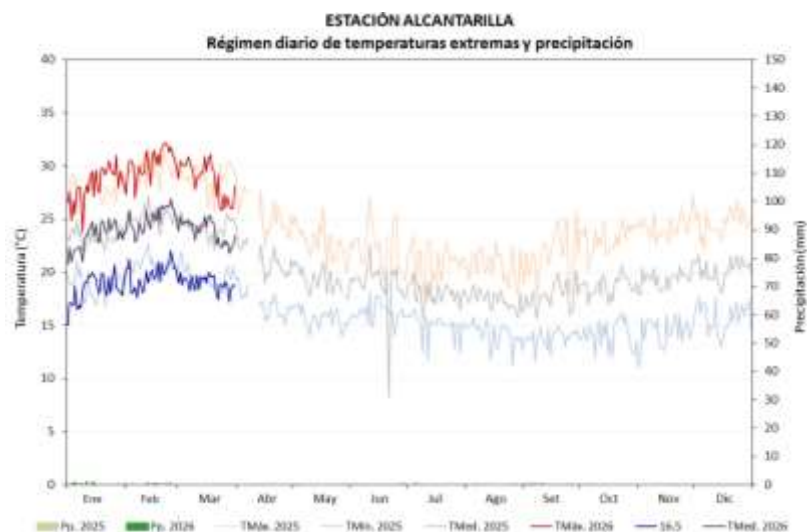
MONITOREO DEL CULTIVO DE MAIZ ESTACIÓN ALCANTARILLA: FASES FENOLÓGICAS DEL MAÍZ AMARILLO var. DEKALB 7508