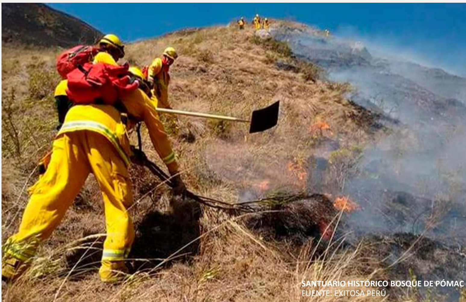
SANTUARIO HISTÓRICO BOSQUE DE PÓMAC

https://www.senamhi.gob.pe/site/incendio/?p=boletines-semanales-incendios&blt=dz02