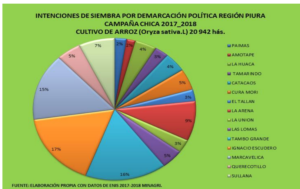
Grafico N° 01