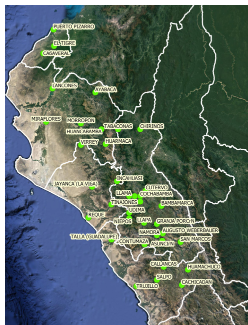
MAPA 1 UBICACIÓN DE LAS ESTACIONES DE MONITOREO