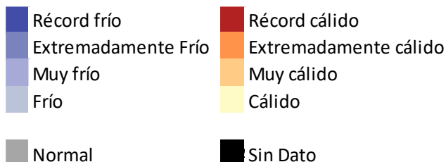
Tabla 2. Valores mínimos de la temperatura mínima.

Se registraron noches cálidas generalizadas, siendo más intensas hacia inicios y finales del periodo, junto con olas de calor de hasta cuatro noches, con temperatura récord en Puno.