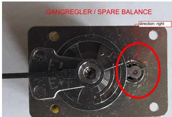
Rueda de escape del sistema de relojería metálica