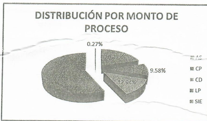
Tabla 11 DETALLE DE TIPO DE PROCEDIMIENTO

"Decenio de la Igualdad de oportunidades para mujeres y hombres" "Año del Dialogo y la Reconciliación Nacional"